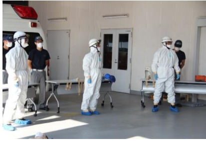
感染防止対策完了