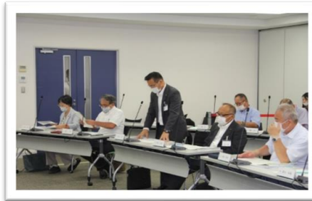
質問中の杉村議員