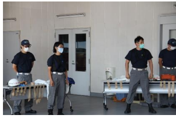
熱中症対策用クールベスト装着