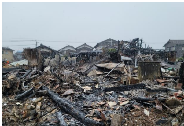
⑥ 火災現場の状況(珠洲市宝立町鶺鴒)