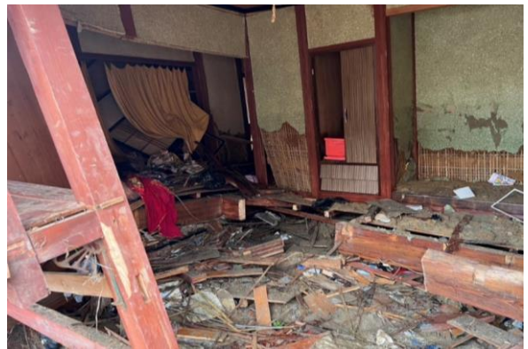
③ 建物倒壊状況(珠洲市宝立町鶺鴒)