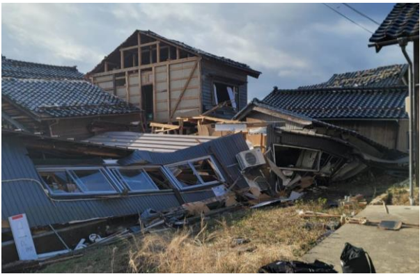
④ 救出現場 (珠洲市宝立町春日野)