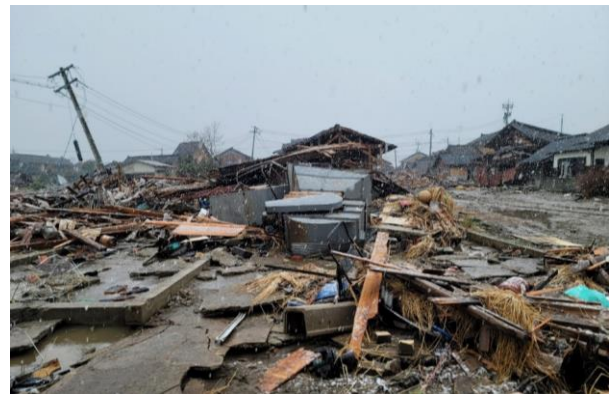
⑤ 津波被害状況(珠洲市宝立町鶺鴒)