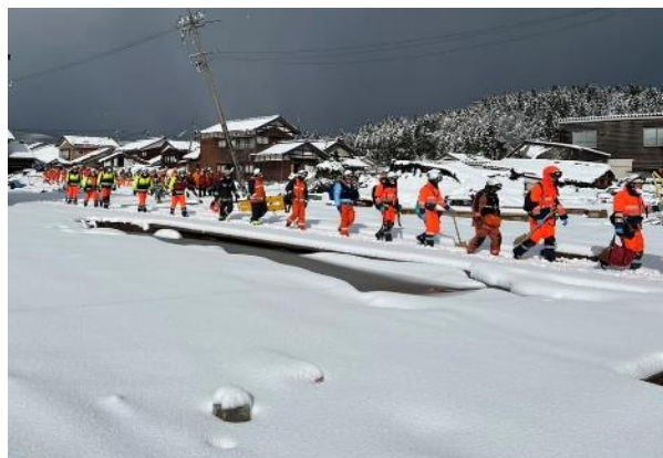
⑨ 活動現場への出動状況(珠洲市宝立町鶺鴒)