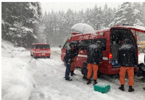
⑧ 降雪状況(珠洲市内 一般道)