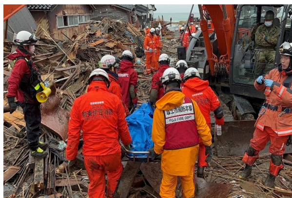
⑩ 救出現場での活動状況 (珠洲市宝立町春日野)