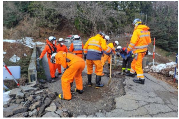
② 道路寸断状況(珠洲市若山町白滝)