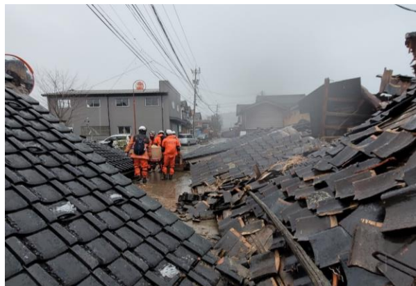
⑦ メイン道路の状況(珠洲市宝立町鶺鴒)